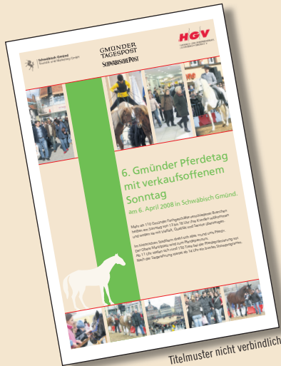
Titelmuster nicht verbindlich